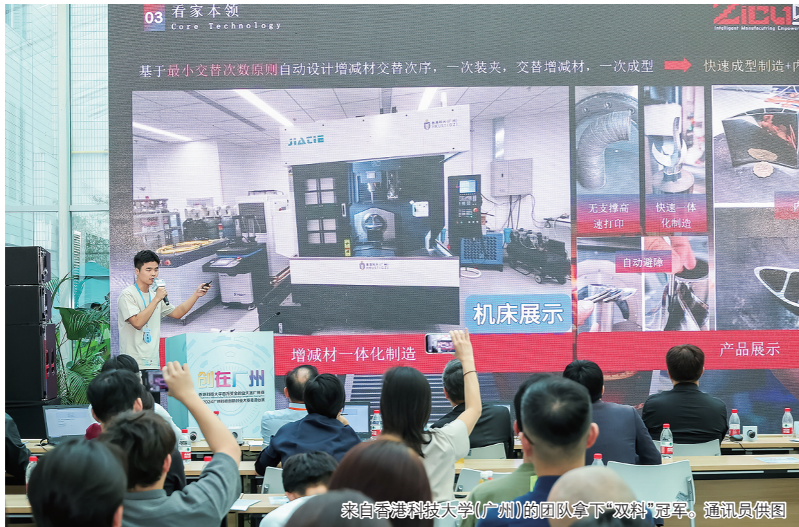
来自香港科技大学(广州)的团队拿下“双料”冠军。

近期,香港科技大学百万奖金创业大赛广州赛区暨2024广州科技创新创业大赛港澳台赛(以下简称“双料”决赛、第二届粤港澳大湾区博士博士后双创大赛复赛(以下简称“第二届双创大赛”)等科技创新领域的重磅赛事,在南沙轮番上演。来自粤港澳大湾区的科技精英们,充满自信和激情地展示自己的创新成果,呈现了一场精彩比拼,科创的火花在南沙尽情释放。 南沙新区报记者 罗瑞娟 南方日报记者 吴冠霖 通讯员 谭高昆