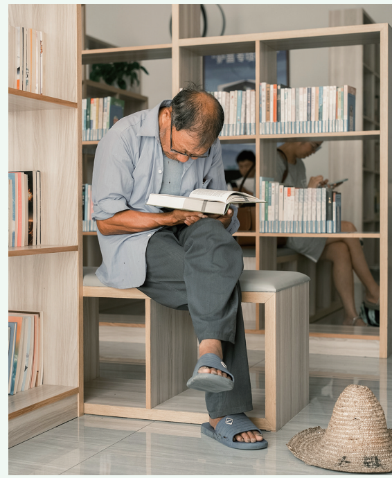
读书纳凉两不误