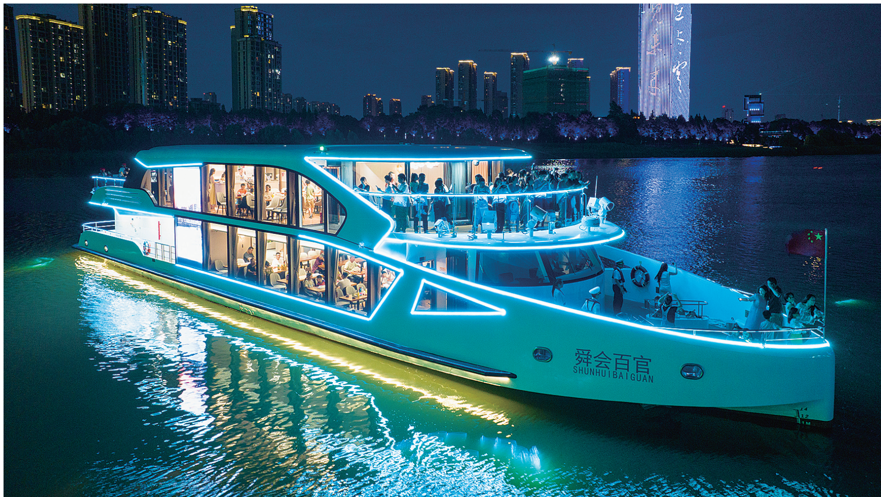
乘游轮感受江风习习