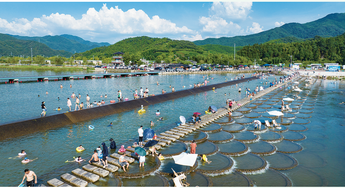
网红水坝夏日顶流