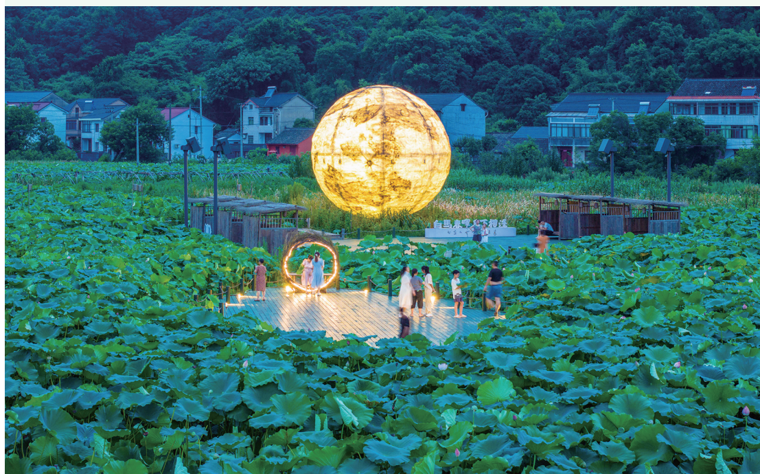
荷塘月色觅清凉