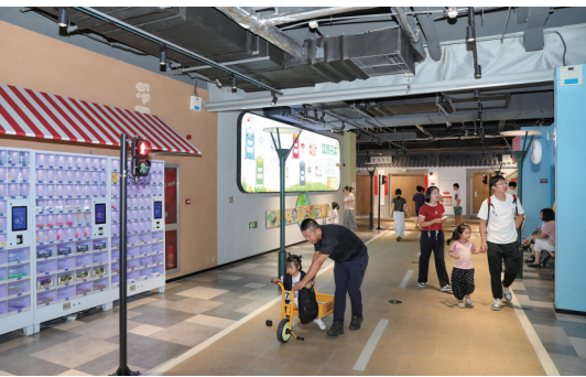
青少年宫里避暑娱乐两不误