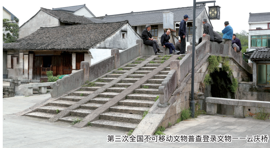
第三次全国不可移动文物普查登录文物——云庆桥

虞甬运河作为浙东古运河的重要一段,全线贯通于两宋时期,新驿亭村地处杭州至宁波古驿道的中心位置,官府公文传递曾在此换马,虞甬运河开通后,又在运河堰坝旁建造房子,设置驿站,驿亭也因此得名。浙东运河全线贯通后的巨大航运功能,迅速壮大了驿亭的交通区位优势,催生出从古至今多种交通态势在这片土地上的多元化呈现。远的不说,1913年萧甬铁路宁波至上虞段率先通车,驿亭站建成营运,使得驿亭成为全省最早有火车经停的村庄之一。近二三十年里,伴随着现代交通方式的不断涌现,杭甬高速公路、新杭甬运河、杭甬高铁等又纷纷从驿亭村境内穿过,它们和古运河一起延续着浙东唐诗之路的岁