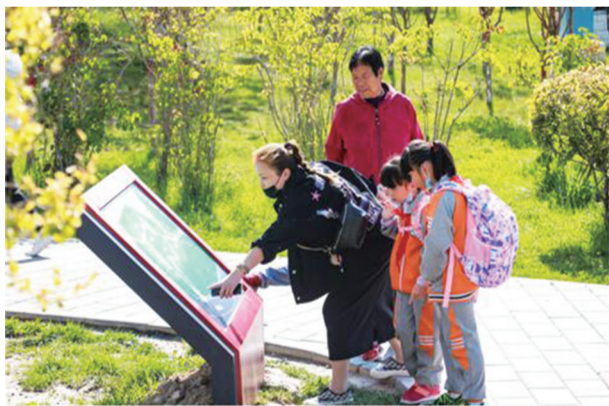
市民正在观看消防主题文化公园平面图

九月初,西宁市首个消防主题文化公园正式落成并向市民开放,不少市民带着孩子前来打卡拍照,在沉浸式互动活动中,强化消防安全意识。公园内的10余个消防主题文化景观集消防文化、园林文化于一体,设计十分巧妙。