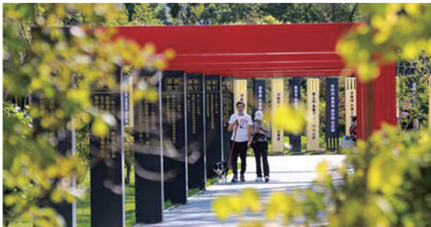
消防主题文化公园内的消防历史长廊