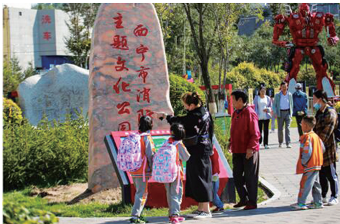
市民游览消防主题文化公园