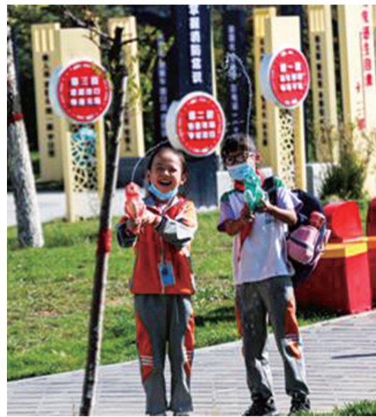
学生们在消防主题文化公园里玩耍

该消防主题文化公园位于西宁市昆仑中路与南川东路交叉口东南侧,与南川河隔路相望。公园的落成,进一步丰富了西宁市消防知识科普教育平台,成为广大群众驻足学习的“室外课堂”,发挥了“小阵地、大宣传”的社会效果。 据人民网