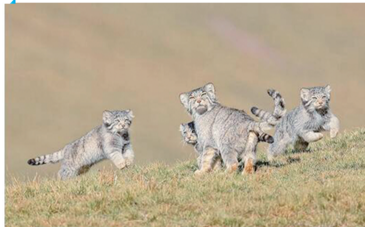
当妈妈说跑步前进