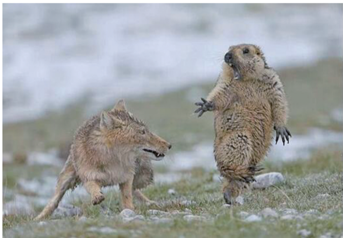
生死对决

近年来,在我省活跃着一批农牧民自发组织的“生态摄影队”,他们拍摄的作品贴近自然,生动再现青海丰富的生物多样性,而且有些作品走出国门,外界通过他们的作品,了解一个不一样的青海。 据青海新闻网