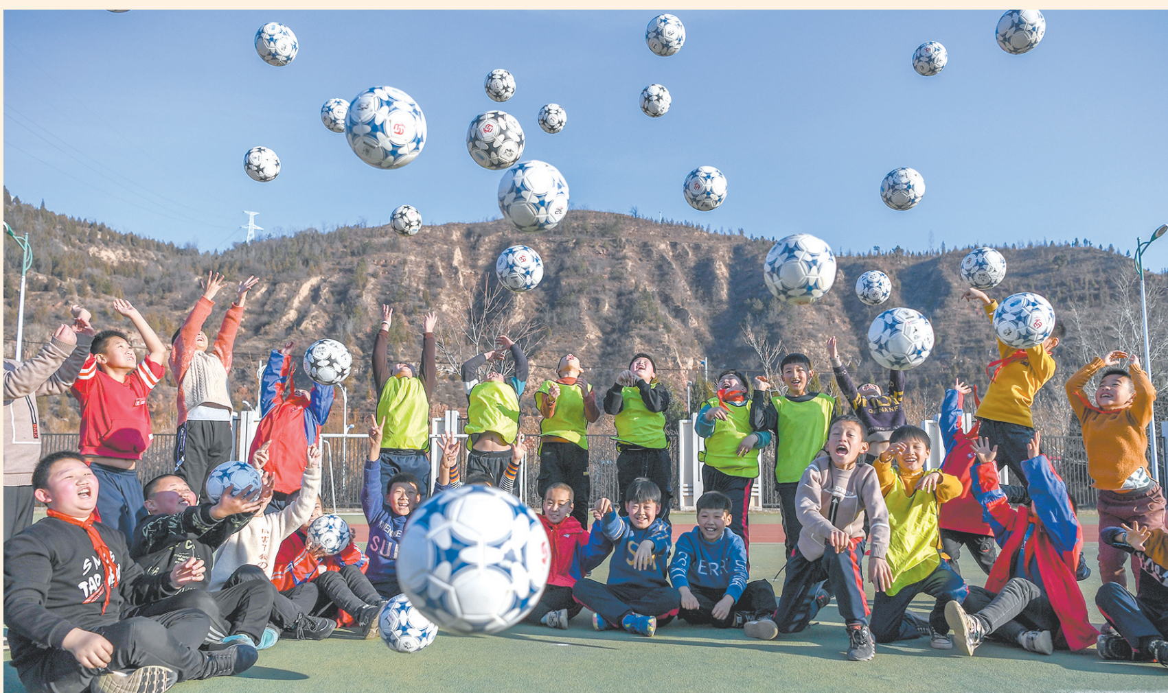
政府出钱看娃 家长安心上班