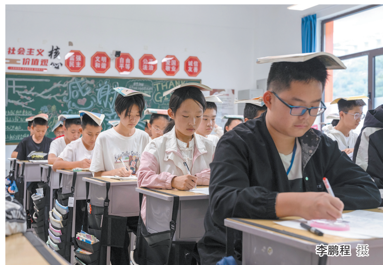
尧师故里 德育铸魂