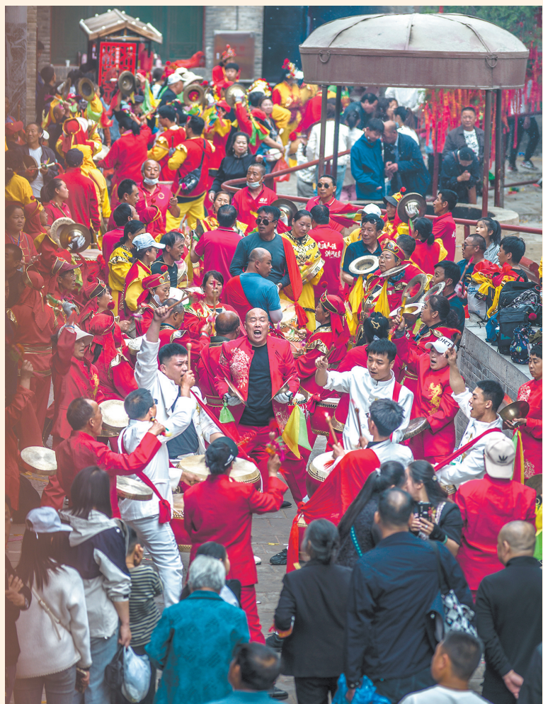
东岳行宫文化之美