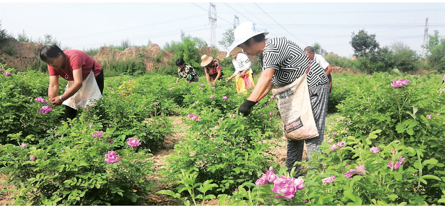
天赐玫瑰种植,因劳动强度小、效益明显,受到农户的欢迎。曲沃县南柴村以土地流转方式集中连片发展天赐玫瑰,把它当作一项农民增收致富的朝阳产业。因为农户在玫瑰园采摘玫瑰鲜花。