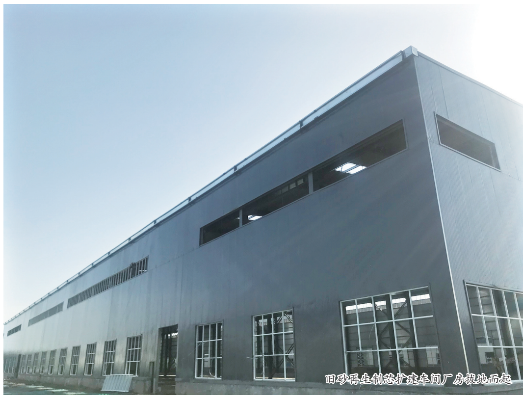
回砂再生制造扩建车间厂房拔地而起

内外金属材料成型领域优秀创新成果的转化和落地,在引进行业内高层次人才的同时,积极培育新动能,打造新产业、探索新模式,为我国高端铸造的发展插上科技与资本的翅膀。