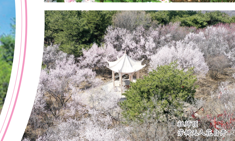
祖师顶 穷村无人花自开