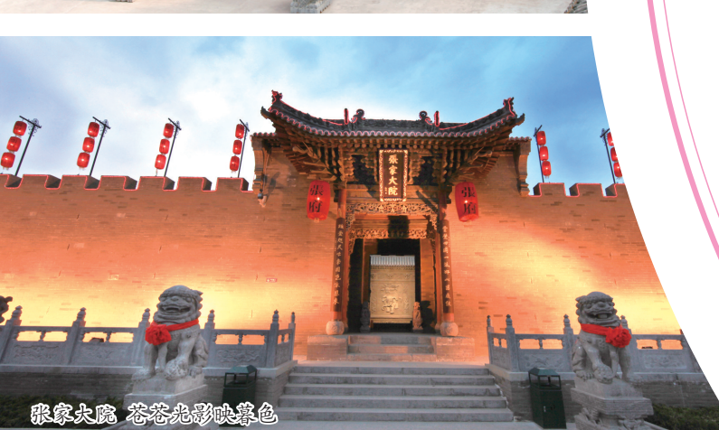
张家大院 苍苍龙影映翠色