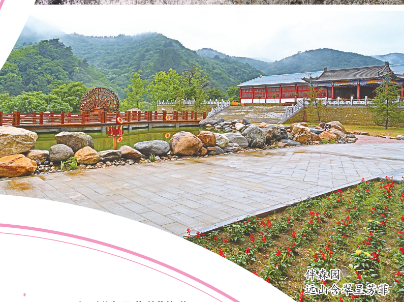
伊家园 起山含翠呈芬菲