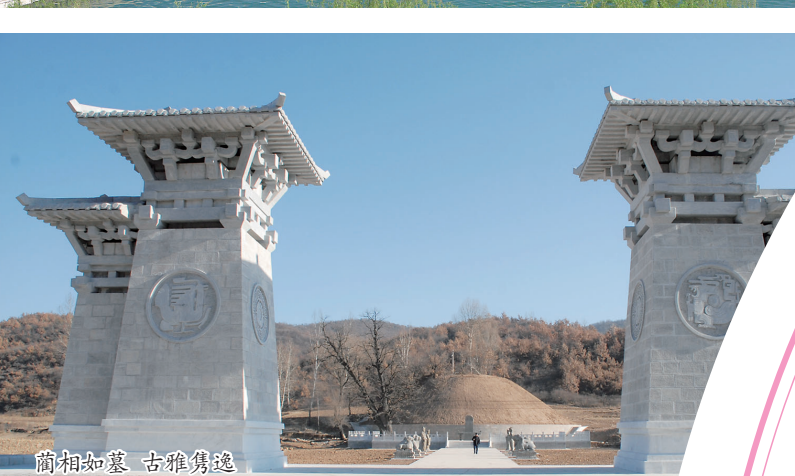
蔺相如墓 古雅集逸

时间：4月19日至5月5日 主办单位：文联 活动内容：组织文艺工作者深入景区开展系列采风活动，积极开展作家写古县、音乐家唱古县、摄影家拍摄古县、书画家画古县活动，征集2021年中国共产党成立100周年、古县建县50周年文艺作品，作品突出古县在经济、政治、文化、社会、生态文明建设等方面的巨大成就、重大变化。