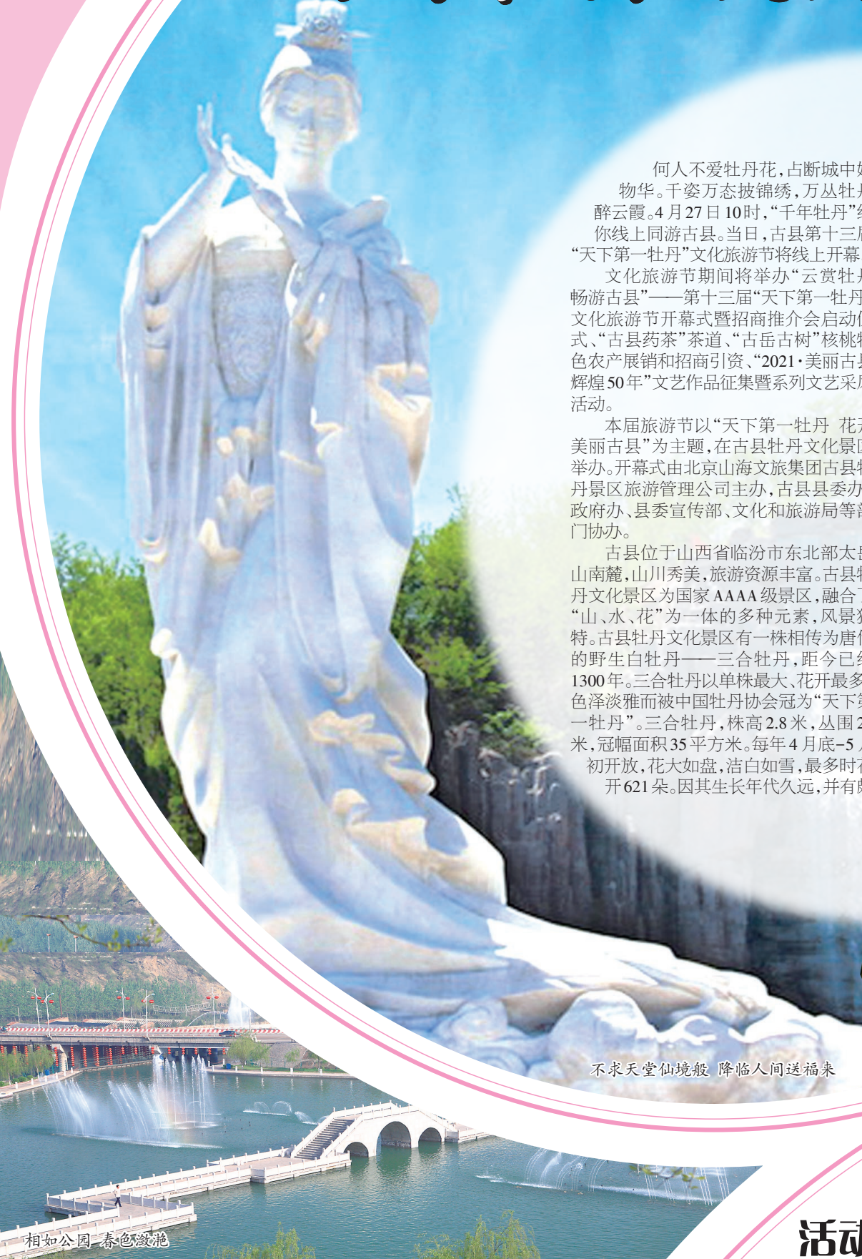
不求天堂仙境般 降临人间送福来