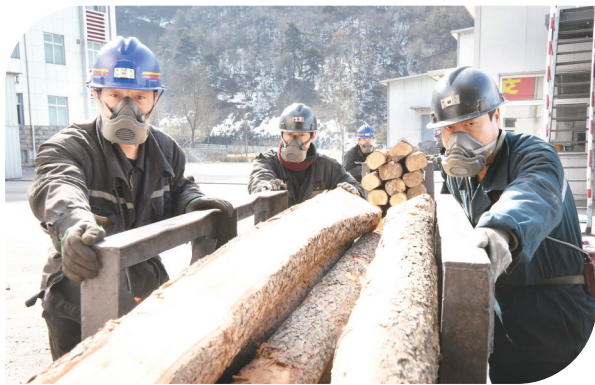
2月18日,在古县老母坡煤业有限公司、东方洗煤厂,工人们正在进行企业复工复产准备工作。连日来,古县严格执行复工复产预案,在落实好佩戴口罩、体温测量、场所消毒、分散就餐等防护措施的前提下,部分企业陆续开始复工复产准备工作。(左图为古县老母坡煤业有限公司工人正在准备复工复产,下图为东方洗煤厂工人检修设备。)