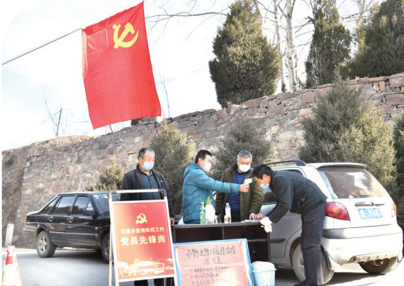
▶自新冠肺炎疫情暴发以来,古县石壁乡在各个防疫监测点设立了党员先锋岗,积极做好人员排查、筛查、外来人员劝返、出入车辆核查、人员身份信息登记等工作。