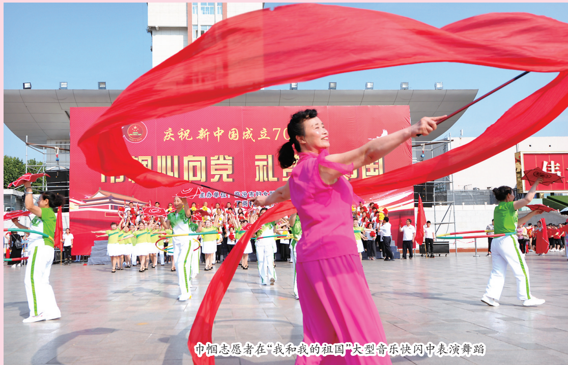
巾帼志愿者在“我和我的祖国”大型音乐快闪中表演舞蹈