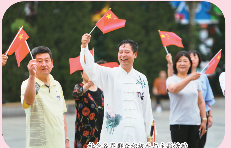
社会各界群众积极参与主题活动