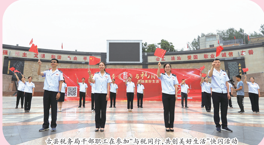
古县税务局干部职工在参加“与税同行,共创美好生活”快闪活动