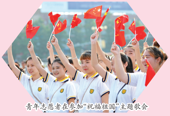
青年志愿者在参加“祝福祖国”主题歌会