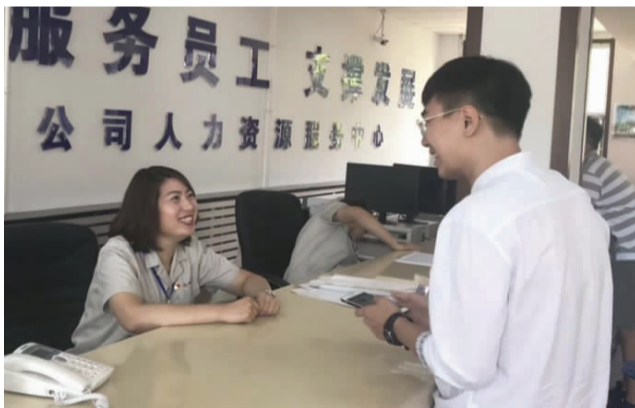
新员工办理入职。

“新生微信群里面分享的新员工报到流程指引示意图以及我们未来体检、培训、参观等日程安排,从7月10日到20日,每天都有安排,要干什么,清清楚楚,让我们新员工心里有数。”填写《新员工登记表》、完成信息